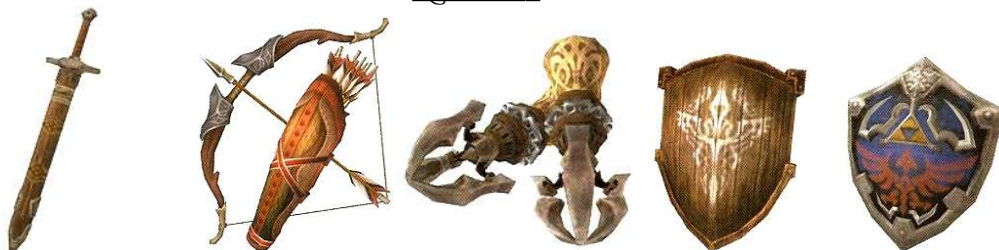
Epée Normale Hylien 30 Rubis