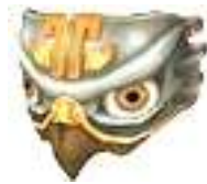
Œil du faucon 70 Rubis