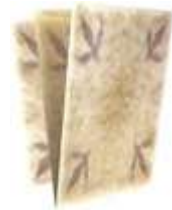
Cartes postales 3 Rubis les 5