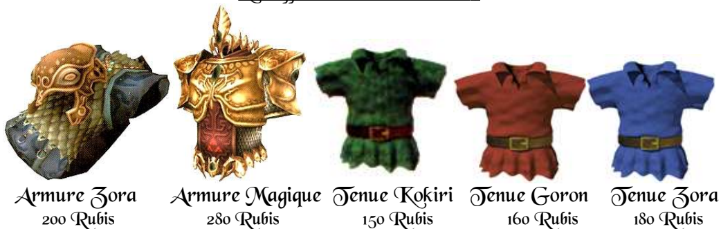
Armure Zora 200 Rubis