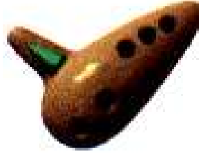
Ocarina 20 Rubis

Comme vous pouvez le constater, « Cashpalace » vend les meilleurs articles aux prix les plus bas du marché. Un soulagement pour la population car avec les galeries César et Balder, notre porte monnaie avait de quoi souffrir .