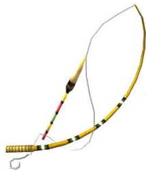
Canne à pêche 15 Rubis