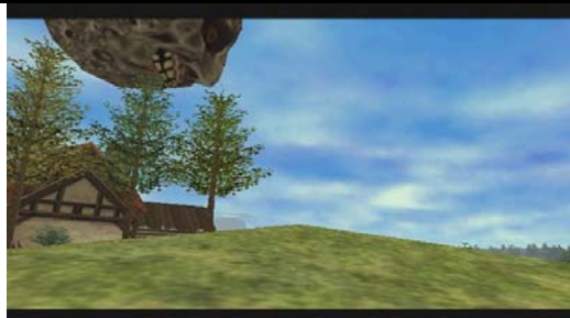
Le ranch Romani Rien à dire...

Attention : Octoroks et Pestes Mojos Dangereuses