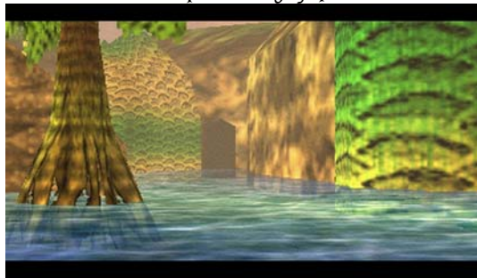
Les marais du sud

Des marais empoisonnés, mais splendides avec des contrastes colorés très beaux.