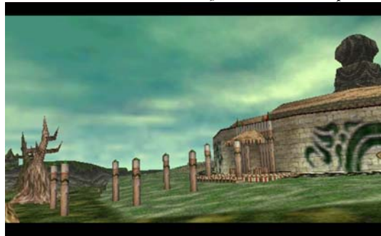
La plaine de Termina Une plaine magnifique.

Nos premières photos nous viennent de Garmania , qui nous envoie les plus belles images de Termina.