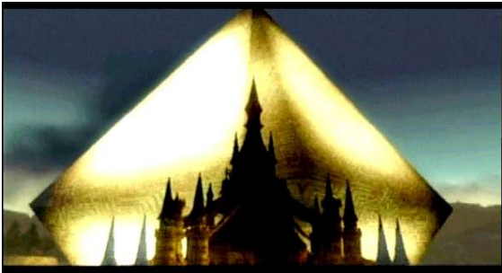
Notre château dans « Legend of Zelda »

Il arrive à représenter Hyrule à la perfection dans ses jeux et je ne peux qu' accepter quand il revient me voir pour me proposer une nouvelle histoire.